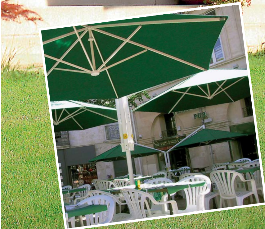
Großes Bild: 4er-Modell – Kleines Bild: 2er- und 3er-Modell