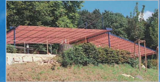
Freistehend, auf Joch angeordnet, ist die wind- und wetterfeste M&F SunTop 3100 die Alternative zu Großschirmen.

Ausgezeichnetes Design mit höchster Funktionalität: Die M&F SunTop Großbeschattungsanlagen.