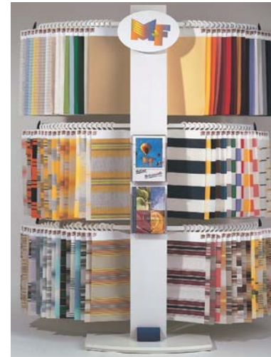
Die Vielfalt der M&F Tuchkollektion

Fragen Sie Ihren Fachhändler nach der M&F-Collection.