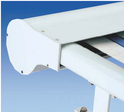
Elegante kompakte Form der Kastenblenden und Führungsschienen