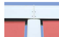
Die Doppel-Leitschiene mit beidseitiger Zwangsführung