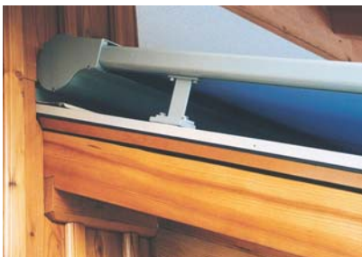
Ausgereifte Technik und aufwendige Verarbeitung – die Garantie für Qualität und lange Lebensdauer.