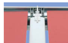
Die stabile Tuchwellenkupplung

Es empfiehlt sich, die M&F WINTERGARTENMARKISE 3000 ab einer Beschattungsfläche von 25 m 2 in mehrere Elemente aufzuteilen. Bei mehr als 400 cm Ausfall stabilisiert 1 Paar – bei mehr als 600 cm 2 Paar Hochschlagsicherungsrohre die Bespannung.