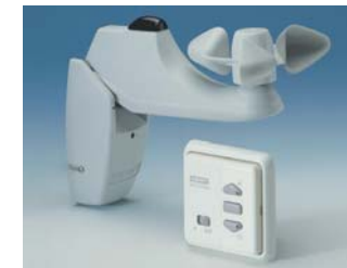
Komfortabel steuern mit Wind- und Sonnenautomatik

Der vollautomatische Wind- und Sonnenwächter (auch mit Regenfühler erhältlich) steuert Ihre M&F WINTERGARTENMARKISE 3000 unabhängig von manuellen Eingriffen. Die Beschattung fährt bei Sonneneinstrahlung rechtzeitig aus und bei starkem Wind und Dunkelheit ein. So profitieren z.B. Pflanzen oder Tiere auch während Ihrer Abwesenheit von einem angenehmen Klima. Außerdem macht Ihr Haus auf außenstehende auch bei längerer Abwesenheit einen bewohnten Eindruck.